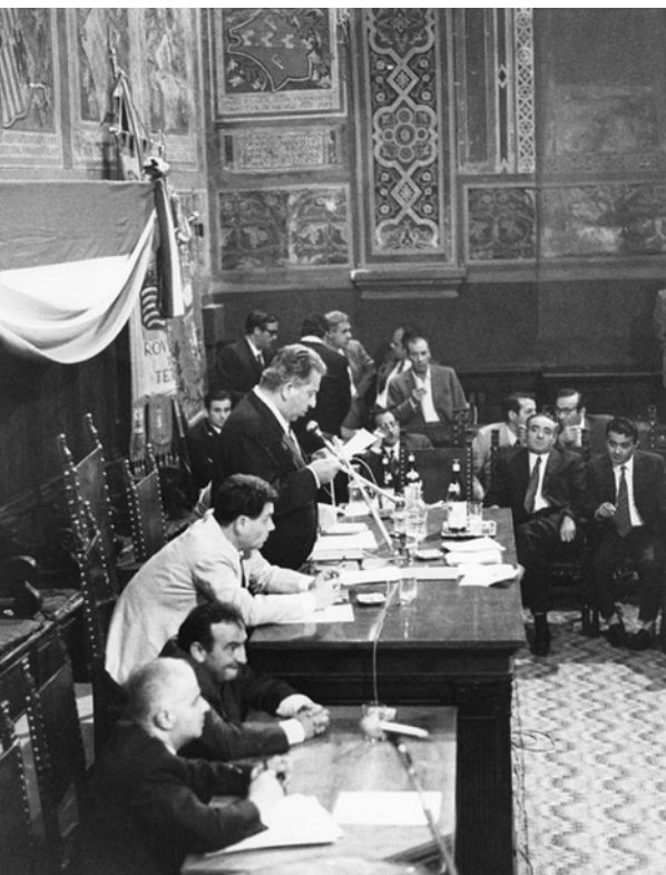
Fabio Fiorelli presiede la prima seduta del Consiglio regionale (Perugia, 20 luglio 1970)